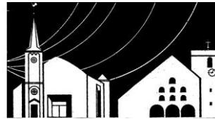
Kirche St. Michael; Kölner Str. 37, WK Kirche St. Apollinaris, Grunewald 23, WK